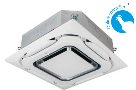
CASSETTE FCAG-B MET UITBLAASPANEEL BYCQ140EP