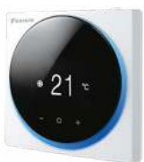
BRC1H519W7 (glanzend wit)