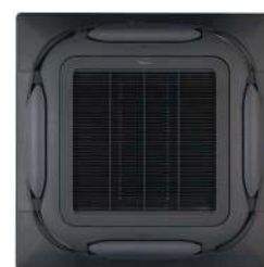
BYCQ140EB Zwart standaardpaneel