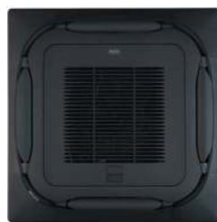
BYCQ140EGFB Zwart zelfreinigend paneel met fijnmazig stoffilter