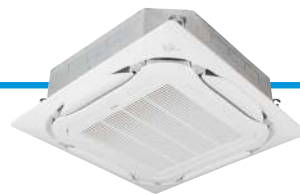
FCAG-B met uitblaaspaneel BYCQ140E