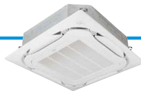
FCAG-B met uitblaaspaneel BYCQ140E