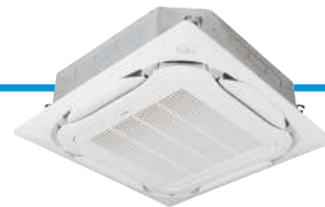
FCAG-B met uitblaaspaneel BYCQ140E