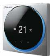
BRC1H519S7 (metallic grijs)