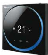
BRC1H519K7 (mat zwart)

*) via de optionele WLAN-adapter BRP069B82. De installatie van een bedrade afstandsbediening is vereist om deze optie voor bediening op afstand te activeren.