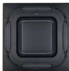
BYCQ140EPB Zwart designpaneel

Daikin Nederland Bel 088 324 54 55 of kijk voor meer informatie op www.daikin.nl .