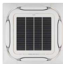
BYCQ140EW Zuiver wit standaardpaneel