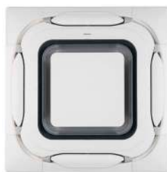
BYCQ140EP Wit designpaneel

Let op: de nieuwe uitblaaspanelen zijn uitsluitend compatibel met de nieuwe "Roundflow" cassettemodellen (FCAG-B, FCAHG-H en FXFQ-B).