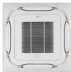
BYCQ140EG(F) Wit zelfreinigend paneel met fijnmazig stoffilter