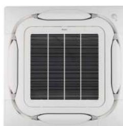
BYCQ140E Wit standaardpaneel